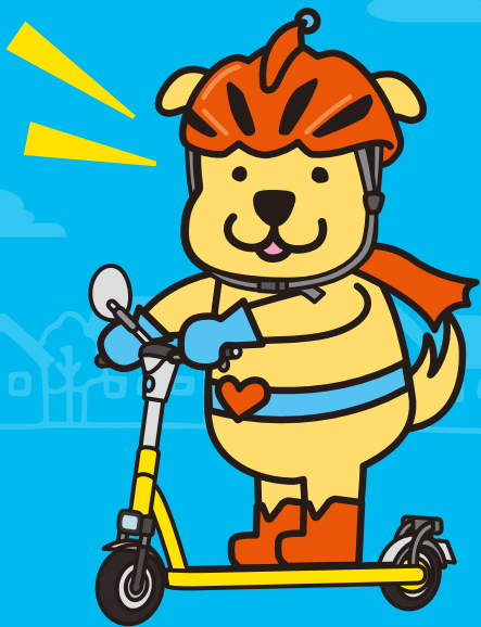
安全安心を推進するマスコットキャラクター みまもりいぬ