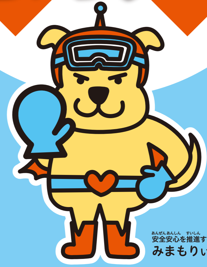
あんぜんあんしん すいしん 安全安心を推進するマスコットキャラクター みまもりいぬ