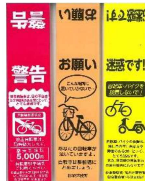
活動時利用した警告札