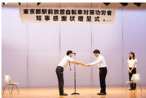
知事感謝状贈呈式の様子