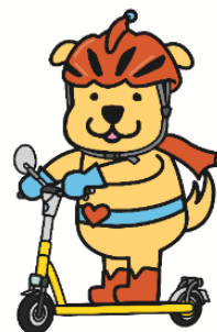
都民の安全安心を推進する マスコットキャラクター みまもりいぬ