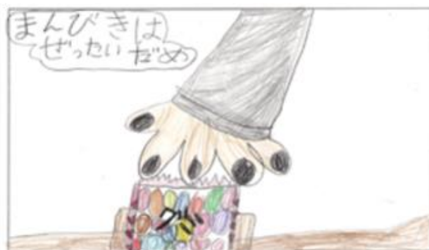
福生市立福生第四小学校 1年生の作品