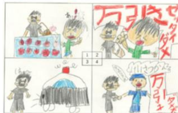
町田市立町田第一小学校 2年生の作品