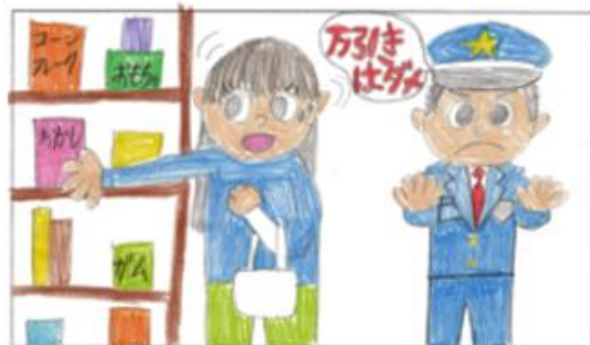
福生市立福生第四小学校 6年生の作品