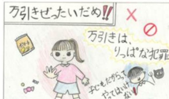
町田市立町田第一小学校 4年生の作品