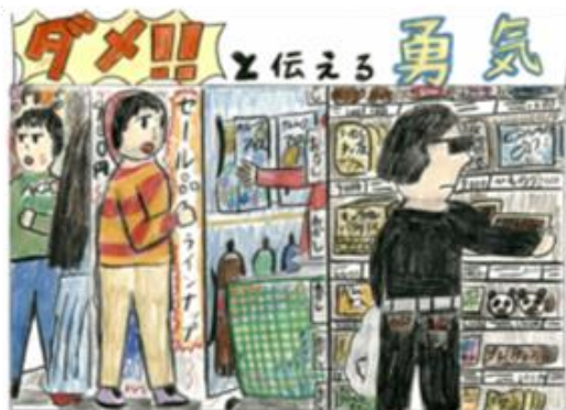
練馬区立光が丘秋の陽小学校 3年生の作品