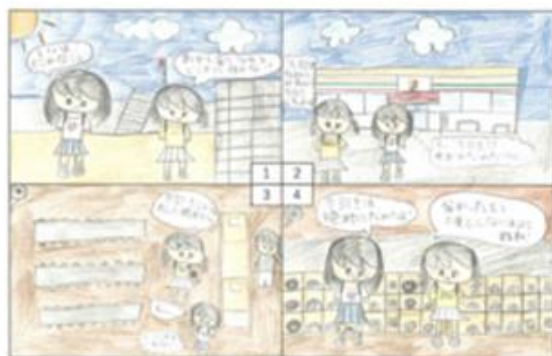
練馬区立光が丘秋の陽小学校 5年生の作品