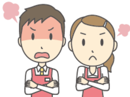
みせ ひと お店の人