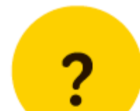
そのほか、 たいせつ ひと あなたの大切な人