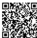
相談ほっとLINE@東京 QRコード