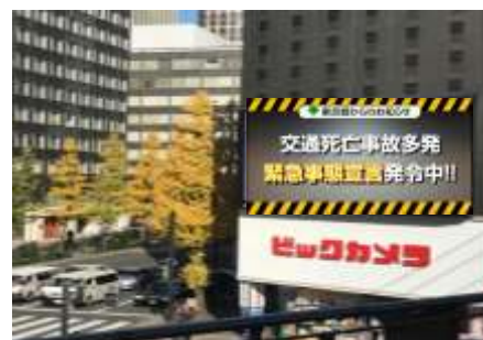
【大型街頭ビジョン】