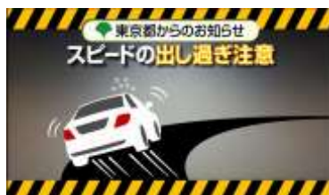
④【速度超過への注意喚起】